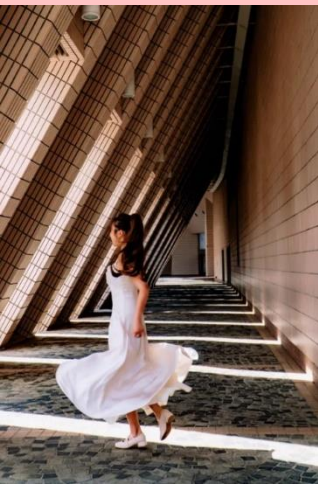
พิกัดถ่ายรูป มุมมหาชน!! Hong Kong Cultural Centre

ค่าที่พักที่ อิสระอาหารค่ำ เพื่อไม่ให้เป็นการเสียเวลาในการช้อปปิ้ง RAMADA GRANDVIEW ระดับ 3 ดาว หรือเทียบเท่า