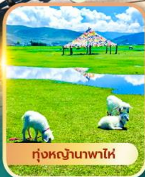
ทุ่งหญ้านาพาไห่