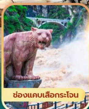
ช่องแคบเลือกระโจน