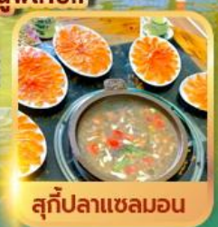
สุกี้ปลาแซลมอน