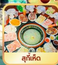
สุกี้เห็ด