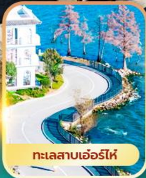
ทะเลสาบเออร์ไห่