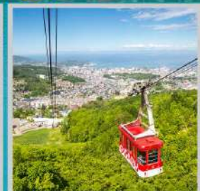
"MT. TENGU ROPEWAY"