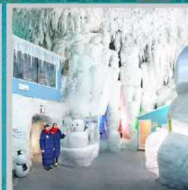
"KAMIKAWA ICE PAVILLION"