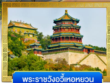
พระราชวังอวิ๋ทอหยวน