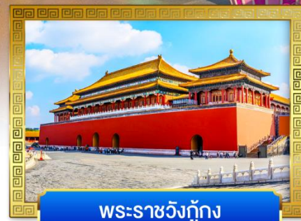
พระราชวังปักกิ่ง